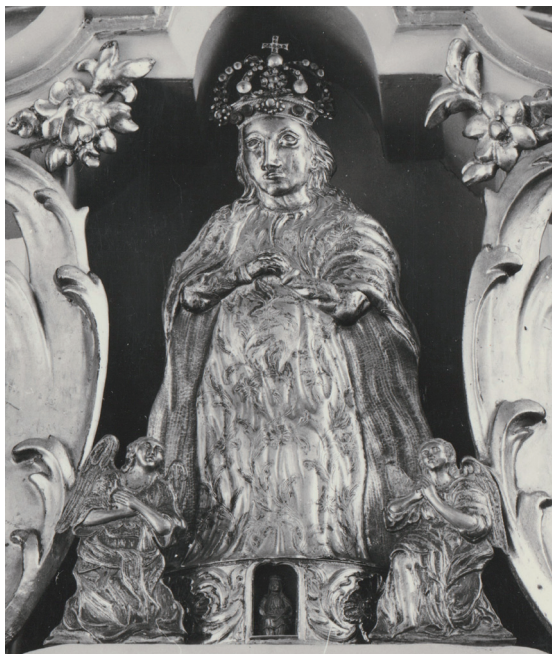
Il. 6. Johann Gottlieb Jantzen, oprawa rzeźby Najświętszej Marii Panny, zaginiona (pierwotnie kościół pw. Narodzenia NMP w Zamartem), 1770 r.

rokokowymi formami. Próba zespolenia bryły z dekoracją ornamentalną, jak nieudolnie zamarkowany skręt rocaillowego trzonu, czy chęć zasugerowania