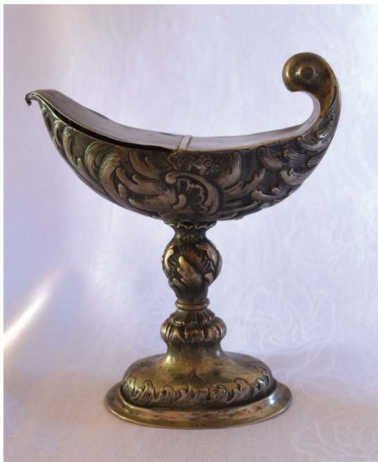
Il. 1. Johann Friedrich Felsch I, Łódka na kadzidło, kościół pw. Ścięcia św. Jana Chrzciciela w Chojnicach, 1768–1773.

Opatrzona została umieszczonymi na kryzie stopy grawerowanymi inicjałami IFF, połączonymi już z Felschem przez J. Kriegseisena, a także liczbą 13, określającą próbę kruszcu 38 .