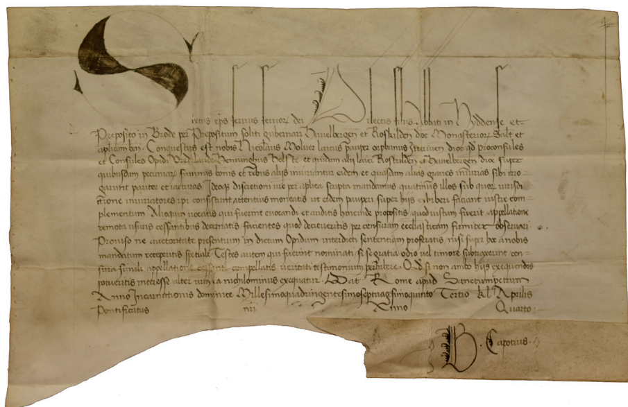
Ryc. 3: Pismo papieża Sykstusa IV z 1475 r.

Wprawdzie wiele tamtejszych dokumentów zachowało się dzięki przeniesieniu archiwum do Greifswaldu, jednak nie obyło się też bez strat 17 . W 1942 r. dokumenty zostały rozdysponowane pomiędzy kilkoma instytucjami. Zbiory przeniesione do Greifswaldu, obejmujące ok. 1500 metrów bieżących materiałów archiwalnych, stanowią dziś trzon Archiwum Państwowego w Greifswaldzie, założonego po 1945 r. Spośród ok. 11 000 zachowanych dokumentów średnio-wiecznych 18 ok. 5000 stanowią dokumenty proveniencji kościelnej (ryc. 3) 19 . Prawie 450 dokumentów kościelnych i świeckich oraz inne ważne kopie i kopiały