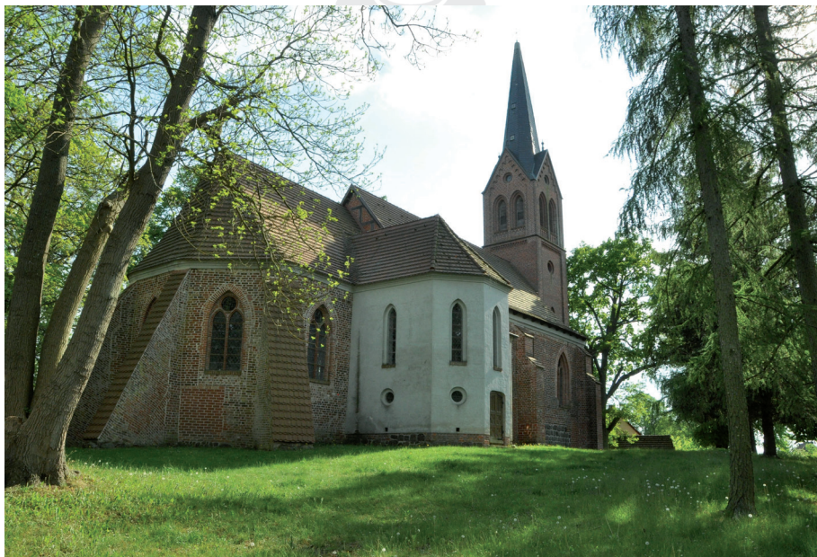
Ryc. 4. Kościół dawnego klasztoru cysterek w Krummin na wyspie Uznam, widok od północnego wschodu

Sporządzane inwentarze miały przeciwdziałać utracie kolejnych budynków oraz być argumentem do zabezpieczania i konserwacji średniowiecznej architektury i dzieł sztuki (ryc. 4). W tym czasie zaczęto też rozwijać badania służące ustaleniu losów wyposażenia, które później dały podwaliny badaniom proveniencyjnym. Bibliografie zabytków budownictwa i sztuki pokazują jednak, że ówczesne prace w dziedzinie historii architektury i sztuki miały wciąż charakter pionierski, ponieważ w większości przypadków korzystano już z zapisów archiwalnych 24 . W latach osiemdziesiątych Akademia Nauk NRD (Akademie der Wissenschaften der DDR) opublikowała serię poświęconą zabytkom