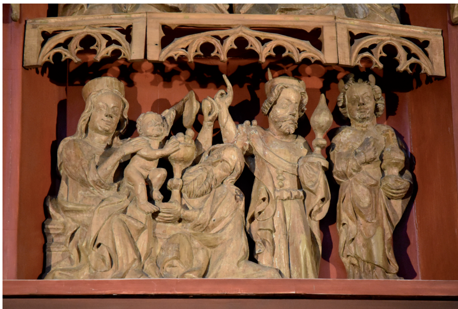
Ryc. 2. Retabulum ołtarzowe, które niegdyś znajdowało się w kościele klasztornym cystersów z Kolbacza, obecnie znajduje się w bazylice archikatedralnej św. Jakuba w Szczecinie. Szczegół adoracji Jezusa przez Trzech Króli

zostały zlokalizowane na podstawie wyników wykopalisk lub źródeł pisanych i historycznych rycin. W tej części projektu utworzono także obszerną kolekcję zdjęć, zawierającą zarówno najnowsze fotografie, jak i zdjęcia historyczne. Część map, planów i fotografii znajdzie się w leksykonie. Na tym etapie powstała także strona internetowa projektu, która pozwala zgłębić informacje o każdym stanowisku 5 . Użytkownicy znajdą tam rys historyczny klasztorów oraz krótkie opisy budynków i wyposażenia. Opisy zostały uzupełnione o informacje o turystyce kulturalnej, np. o lokalnych wydarzeniach czy godzinach otwarcia obiektów.